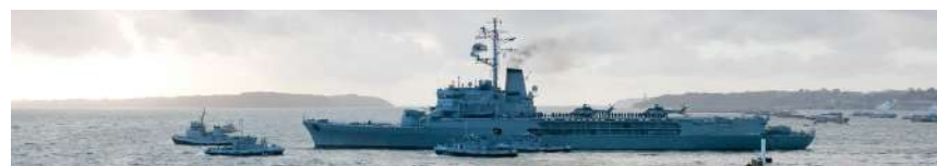
La Jeanne d'Arc dans le goulet de Brest.